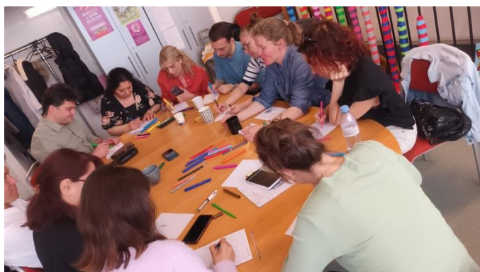
Formation des agent-e-s de santé 2024.

Partenariats institutionnels dont 11 ont accueilli des cycles d'ateliers dans leurs locaux