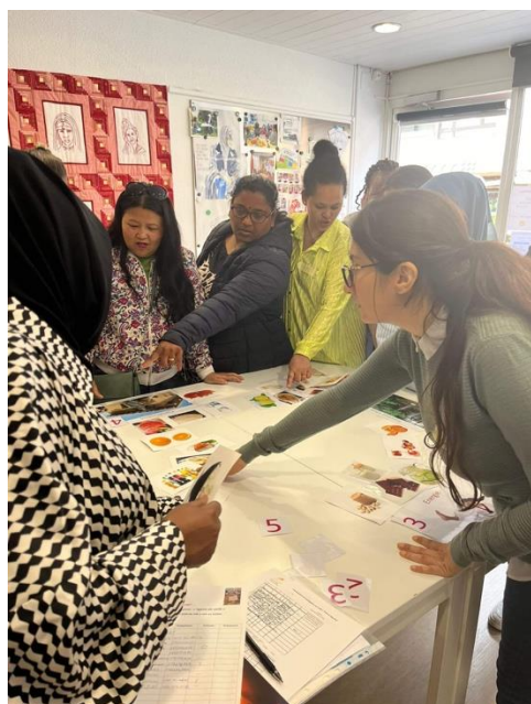
Atelier sur l'alimentation équilibrée.

En 2024, la visibilité auprès des partenaires du monde associatif et institutionnel actifs dans les domaines de la migration et la précarité a été renforcée. De nombreuses interventions ont eu lieu lors de colloques, ainsi que des publications professionnelles et grand public. Cette visibilité accrue ouvre de nouvelles opportunités pour les initiatives à venir.