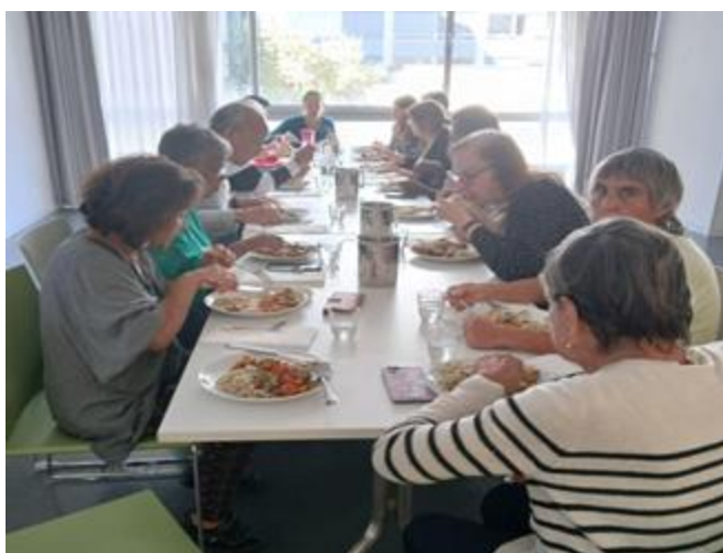
Repas communautaire suite à l'atelier cuisine.

Les échanges furent riches et ont souligné l'intérêt pour cette approche intégrant les pairs.